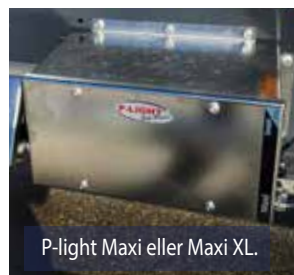
P-light Maxi eller Maxi XL.