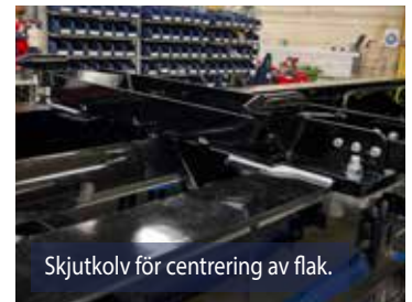
Skjutkolv för centrering av flak.