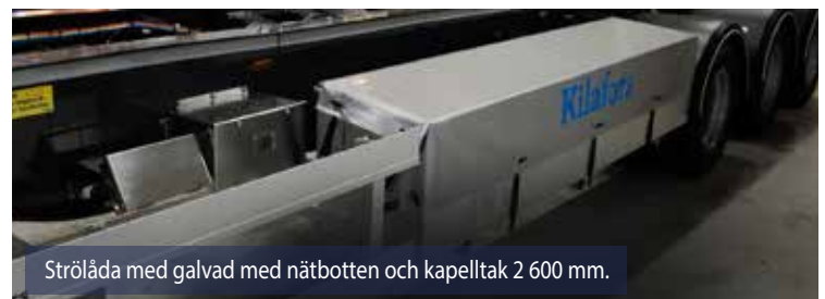
Strörlåda med galvanad med nätbotten och kapelltak 2 600 mm.