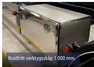
Rostfritt verktygsskåp 1 000 mm.