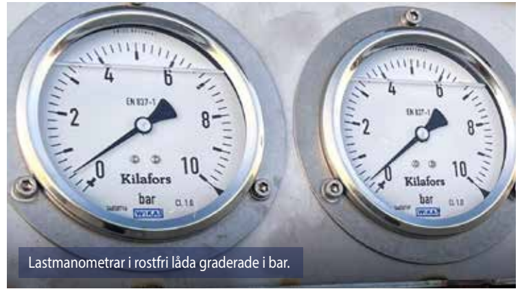
Lastmanometrar i rostfri låda graderade i bar.