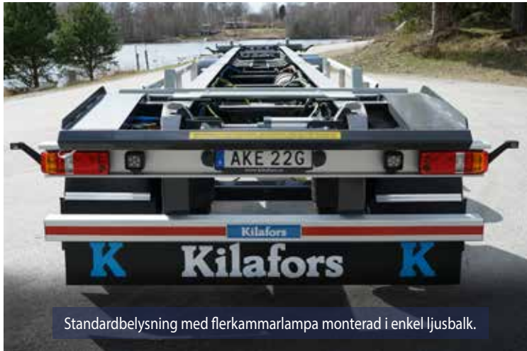
Standardbelysning med flerkammarlampa monterad i enkel ljusbalk.