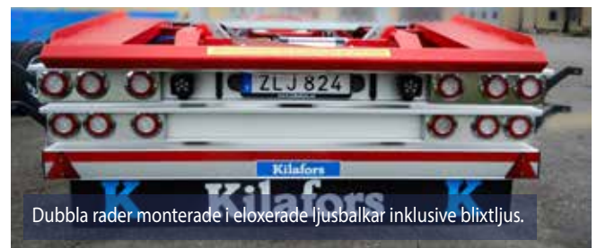
Dubbla rader monterade i eloxerade ljusbalkar inklusive blyxtljus.