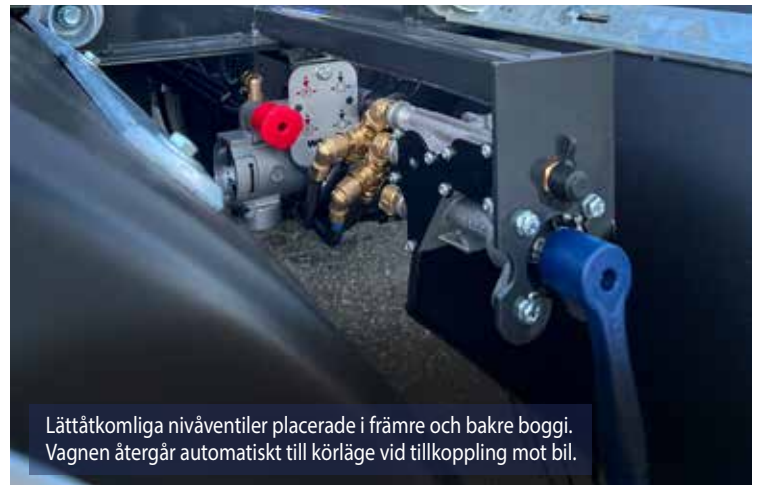
Lättåtkomliga nivåventiler placerade i främre och bakre boggi. Vagnen återgår automatiskt till körläge vid tillkoppling mot bil.