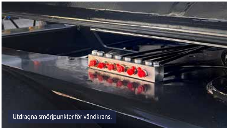
Utdragna smörjpunkter för vändkrans.