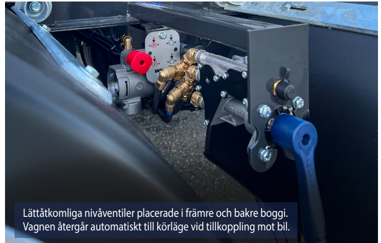
Lättåtkomliga nivåventiler placerade i främre och bakre boggi. Vagnen återgår automatiskt till körläge vid tillkoppling mot bil.