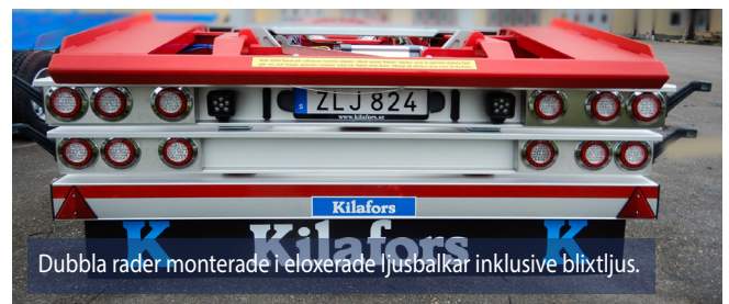
Dubbla rader monterade i eloxerade ljusbalkar inklusive blyxtljus.