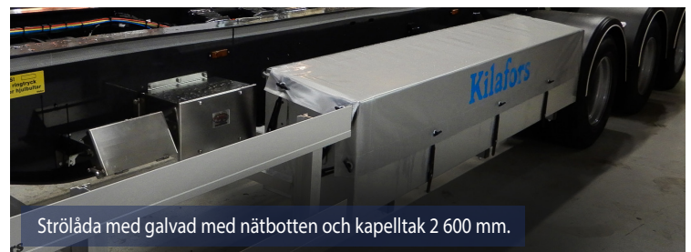
Strörlåda med galvaniserad nätbotten och kapelltak 2 600 mm.