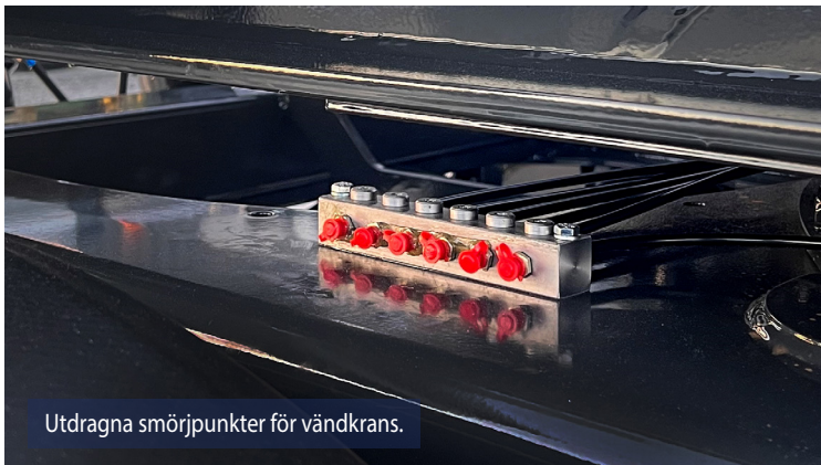
Utdragna smörjpunkter för vändkrans.