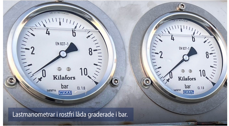
Lastmanometrar i rostfri låda graderade i bar.