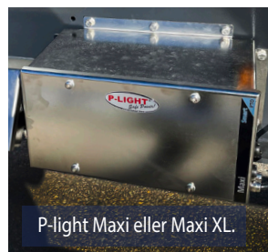
P-light Maxi eller Maxi XL.