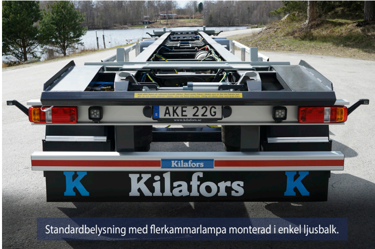
Standardbelysning med flerkammarlampa monterad i enkel ljusbalk.