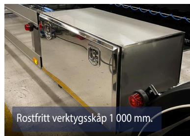
Rostfritt verktygsskåp 1 000 mm.