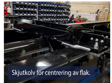
Skjutkolv för centrerung av flak.